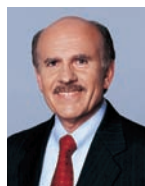
Lou Ignarro, M.D. Prix Nobel de médecine